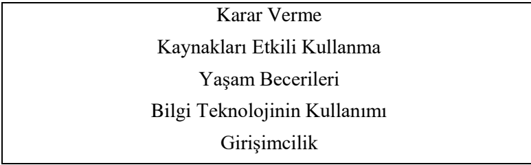
Şekil 1: Başlıca Yaşam Becerileri (Yanık, 2015).

Yaşam becerisi arasında yer alan karar verme, kaynakları doğru bir şekilde kullanma, girişimci olma, sağlıklı iletişim kurma, sorunları çözme, yeteri kadar araştırma yapma, yaratıcı düşünce, konuşma üslubunu güzel kullanma, öz yönetim gibi beceriler yer almaktadır. Değişen ve gelişen koşullarla birlikte teknolojiyi kullanabilme gibi becerilerin günlük yaşam becerileri arasında yer aldığı görülmektedir. Bu bağlamda yaşam becerilerinin kapsamının